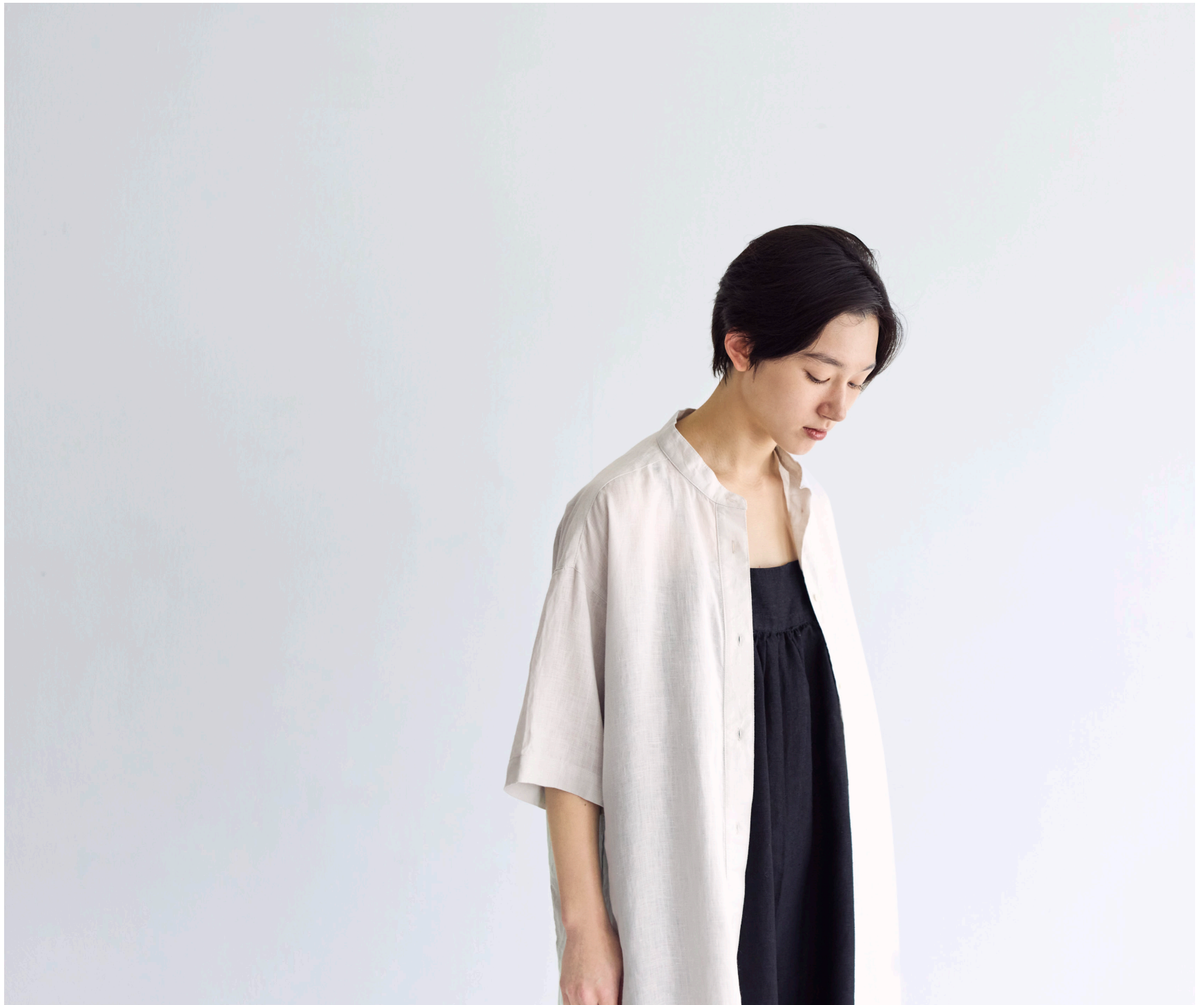
SILVIA DRESS 【LWC052-2697】LANA SALOPETTE 【LWC043-17】