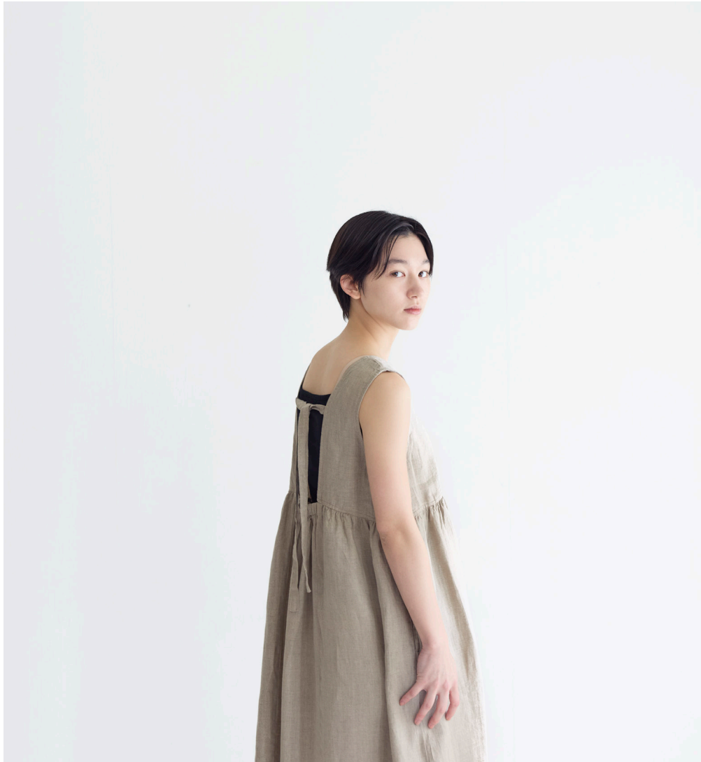
NORA DRESS [LWC041-N]