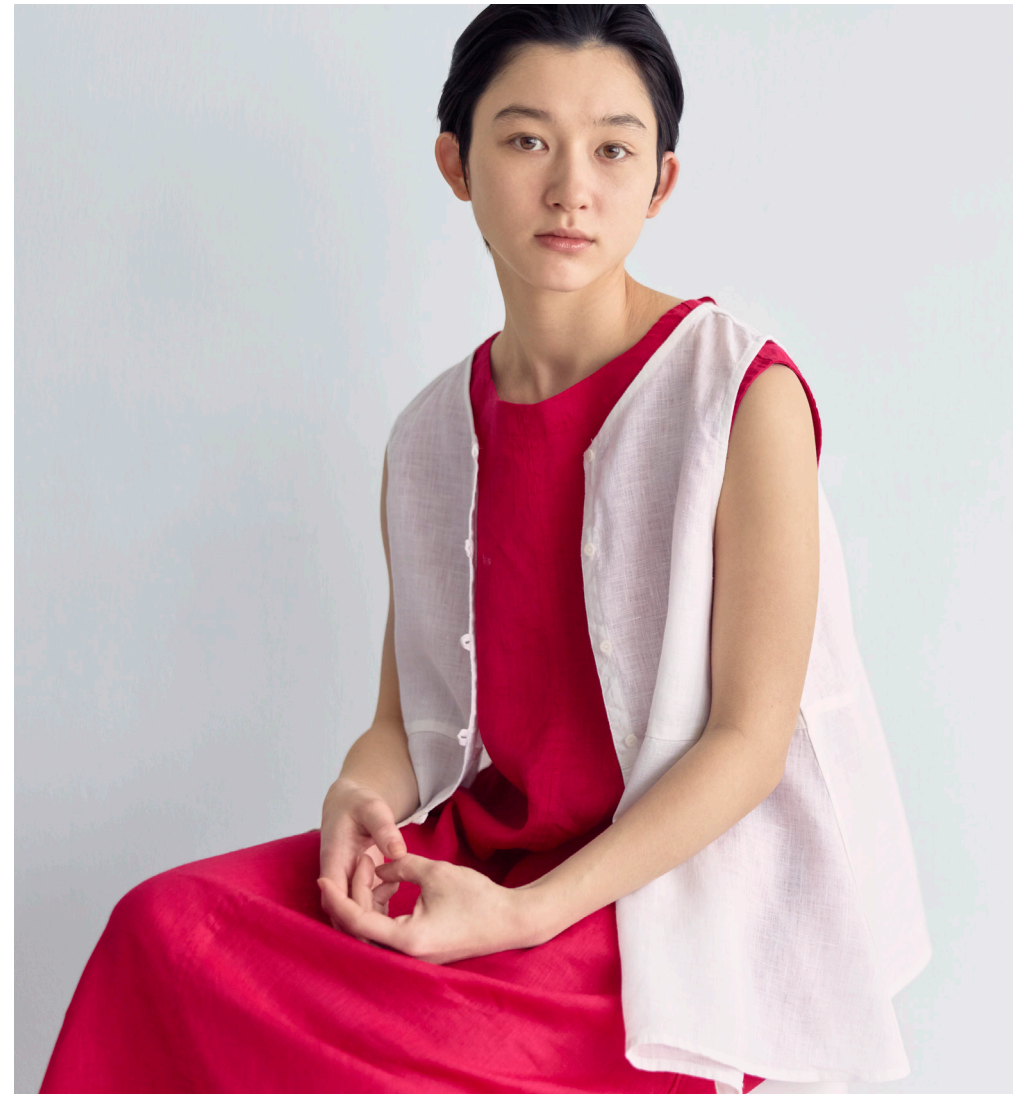
DANIEL DRESS [LWC055-10A] NOEL TOP [LWC039-19]