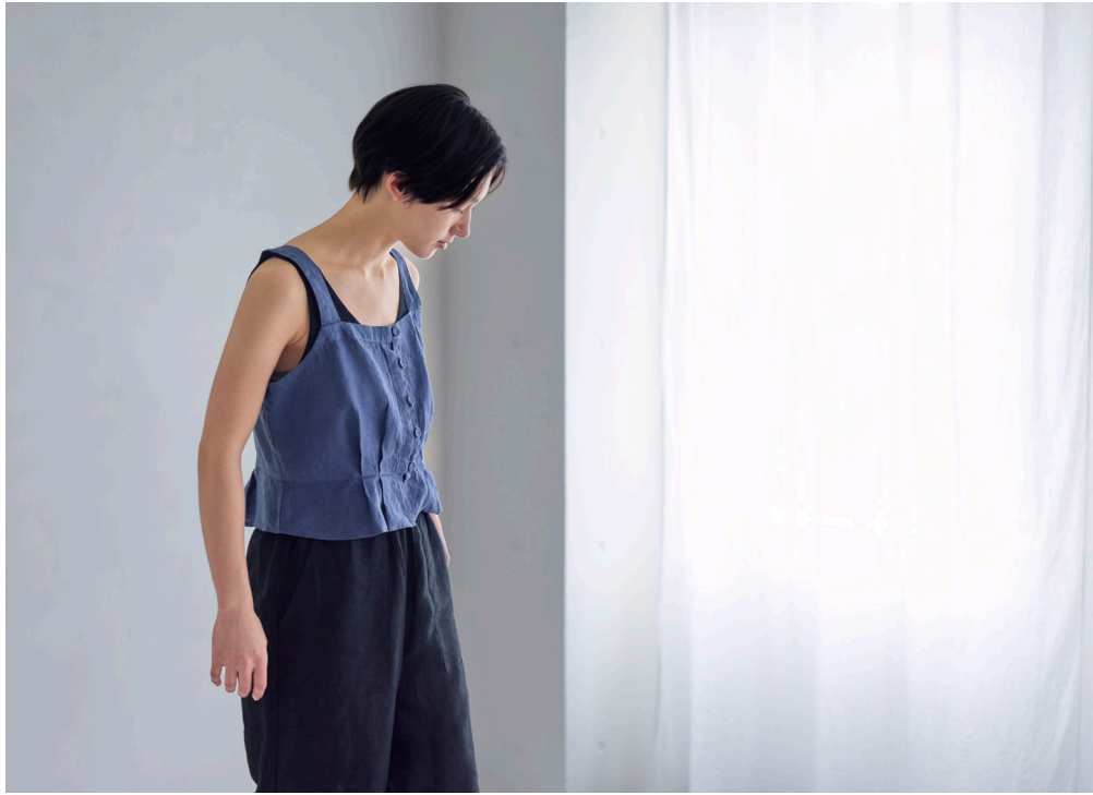
MARIE TOP [LWC040-1193] LEONIE PANTS [LWC057-17]