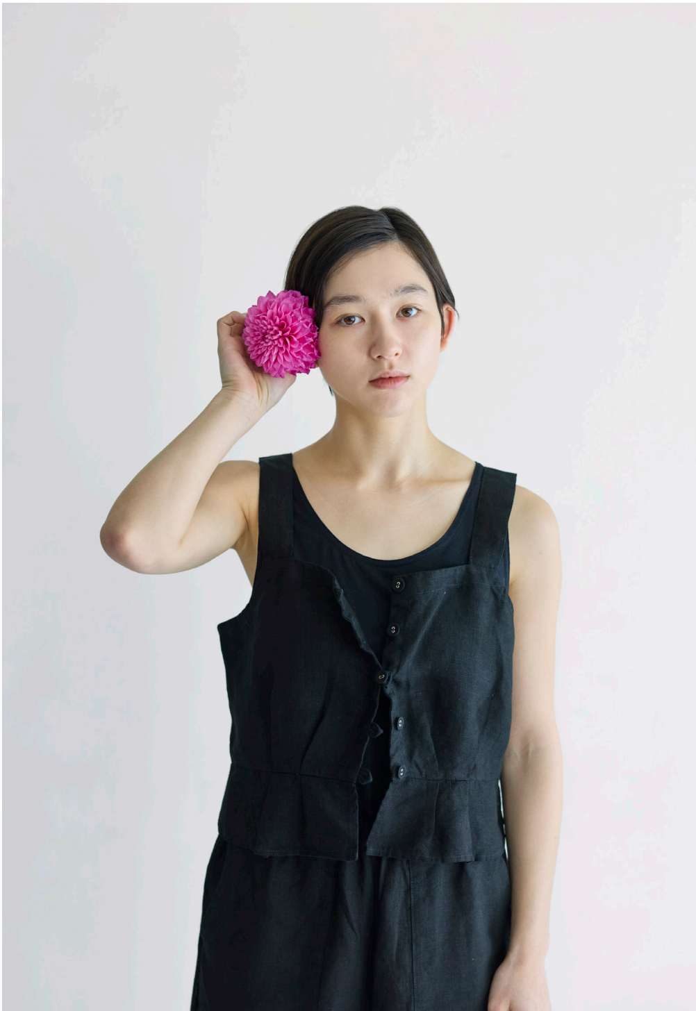
MARIE TOP [LWC040-17] LEONIE PANTS [LC057-17]