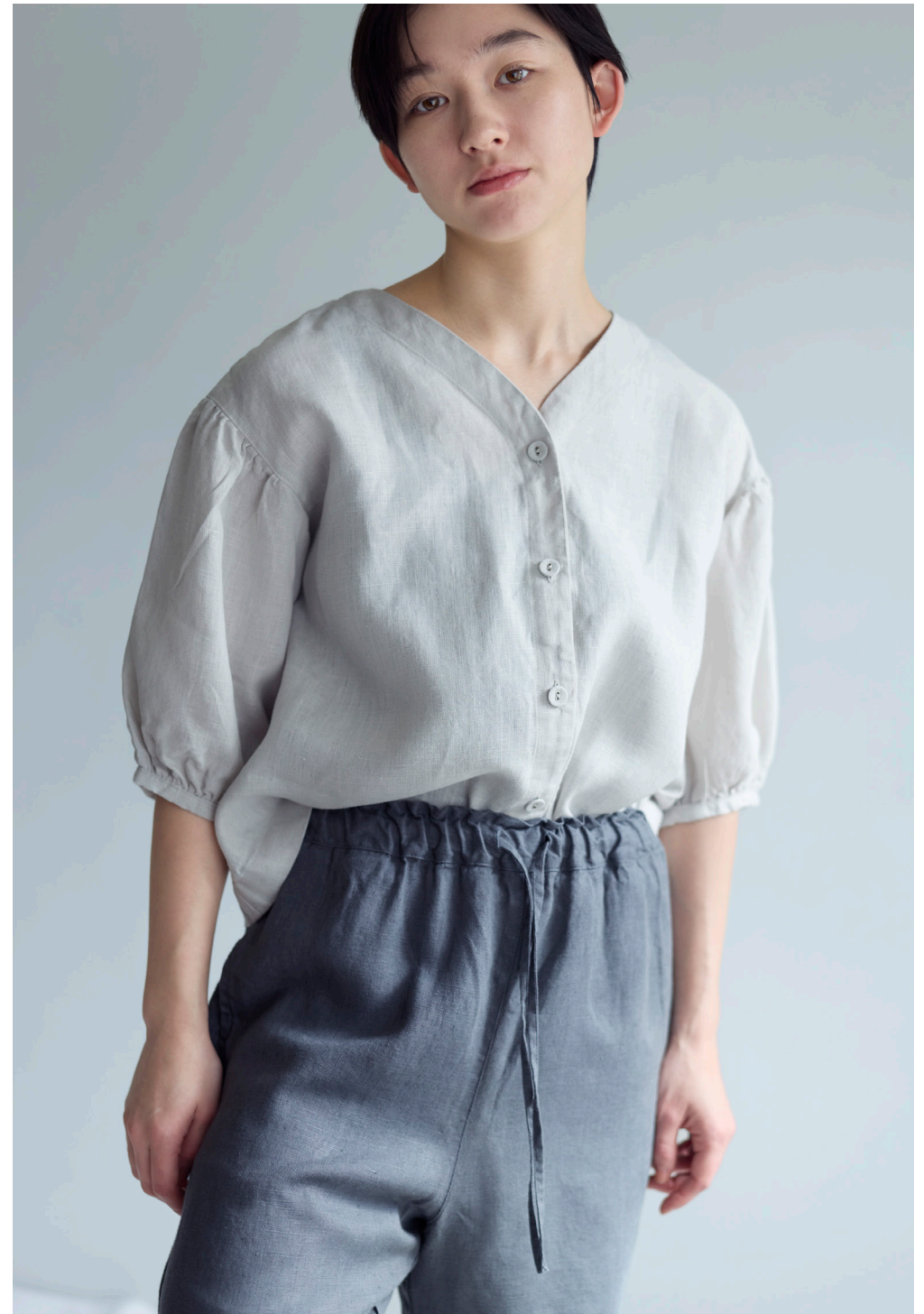
ELAIZA TOP 【LWC048-2697】 VERA PANTS 【LWC042-93】