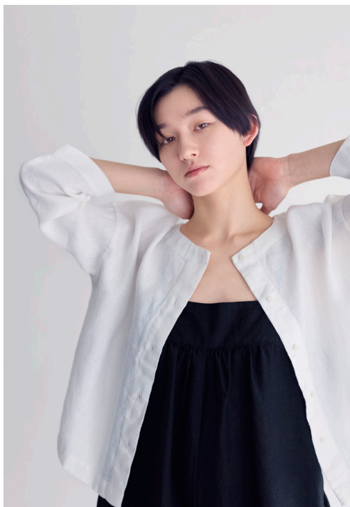
EMILE TOP [LWC045-19] LANA SALOPETTE [LWC043-17]