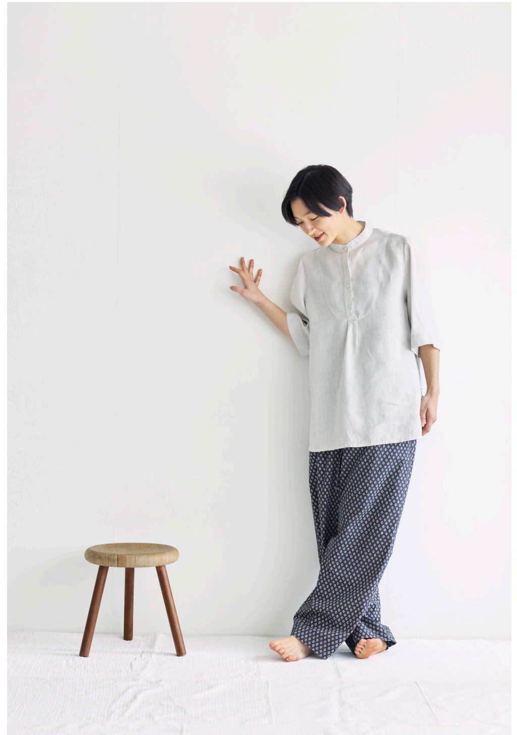
REMY TOP [LWC049-2697] HALKA PANTS [miiThaaii FJW455-72TBK]