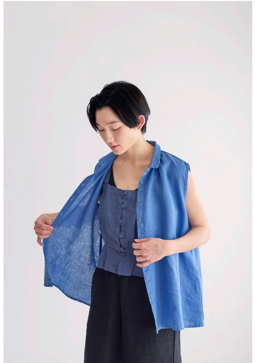
KATIE TOP [LWC038-1644] MARIE TOP [LWC040-1193] LEONIE PANTS [LC057-17]