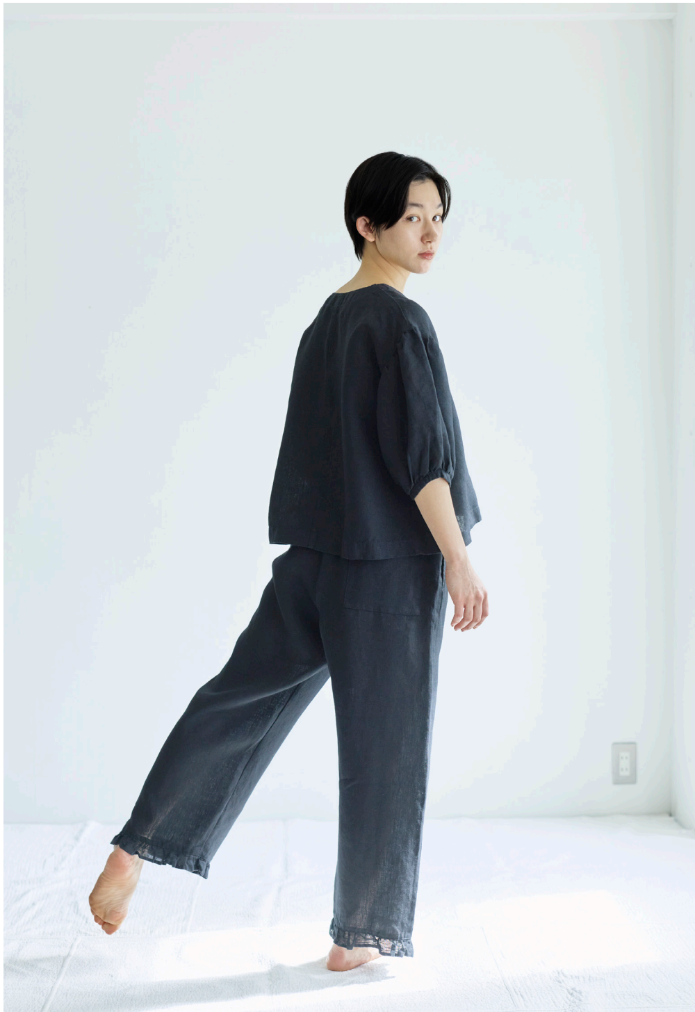
ELAIZA TOP 【LWC048-17】 VERA PANTS 【LWC042-17】