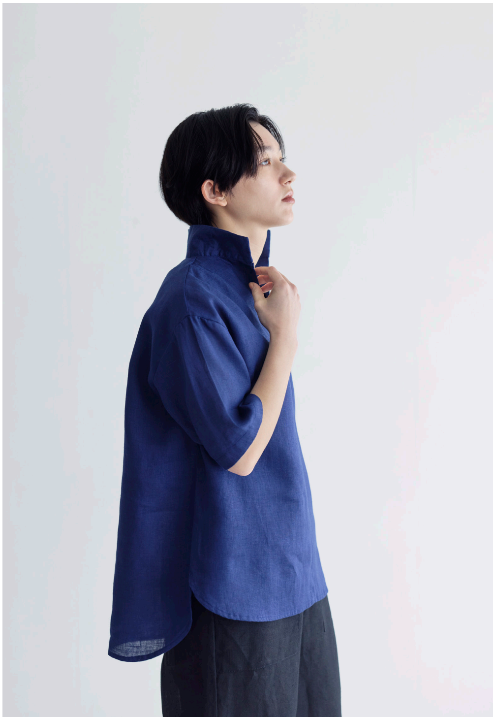
EMEL TOP [LWC047-91] LEONIE PANTS [LC057-17]