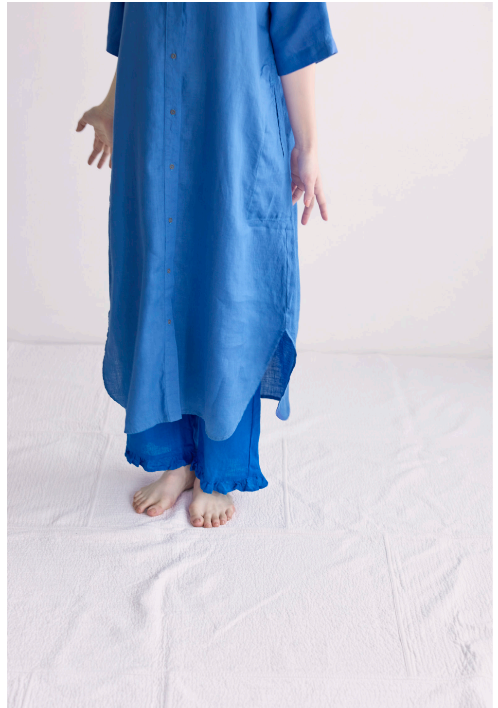
SILVIA DRESS [LWC052-1644] VERA PANTS [LWC042-1175]