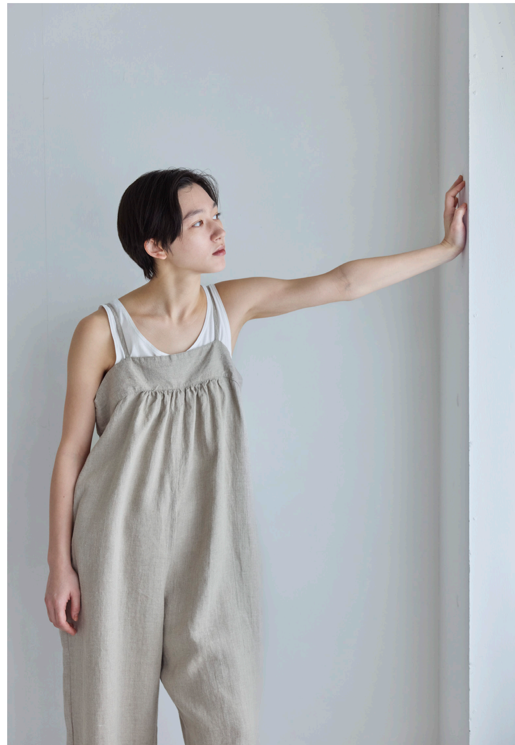
LANA SALOPETTE [LWC043-N]