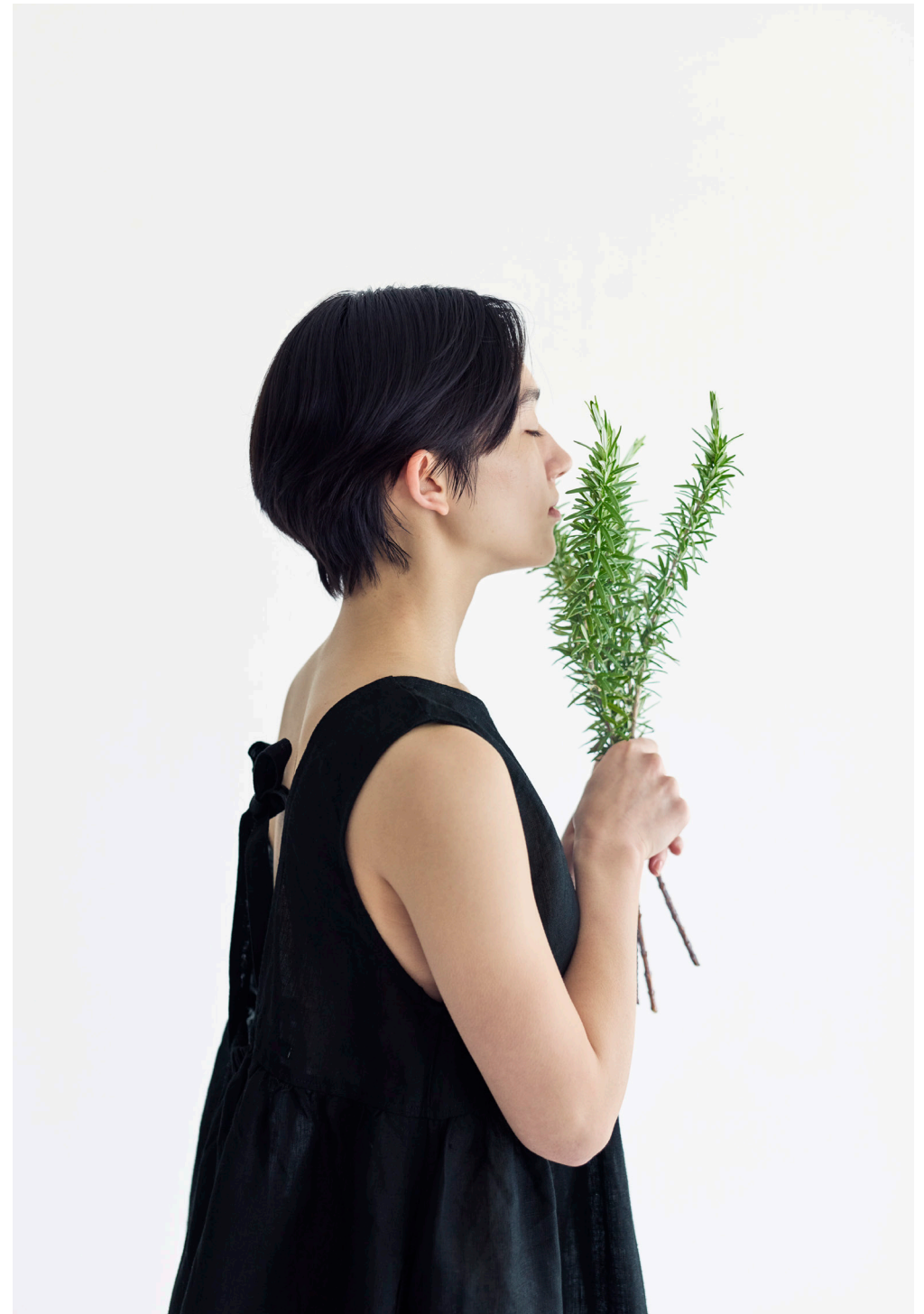
NORA DRESS [LWC041-17]