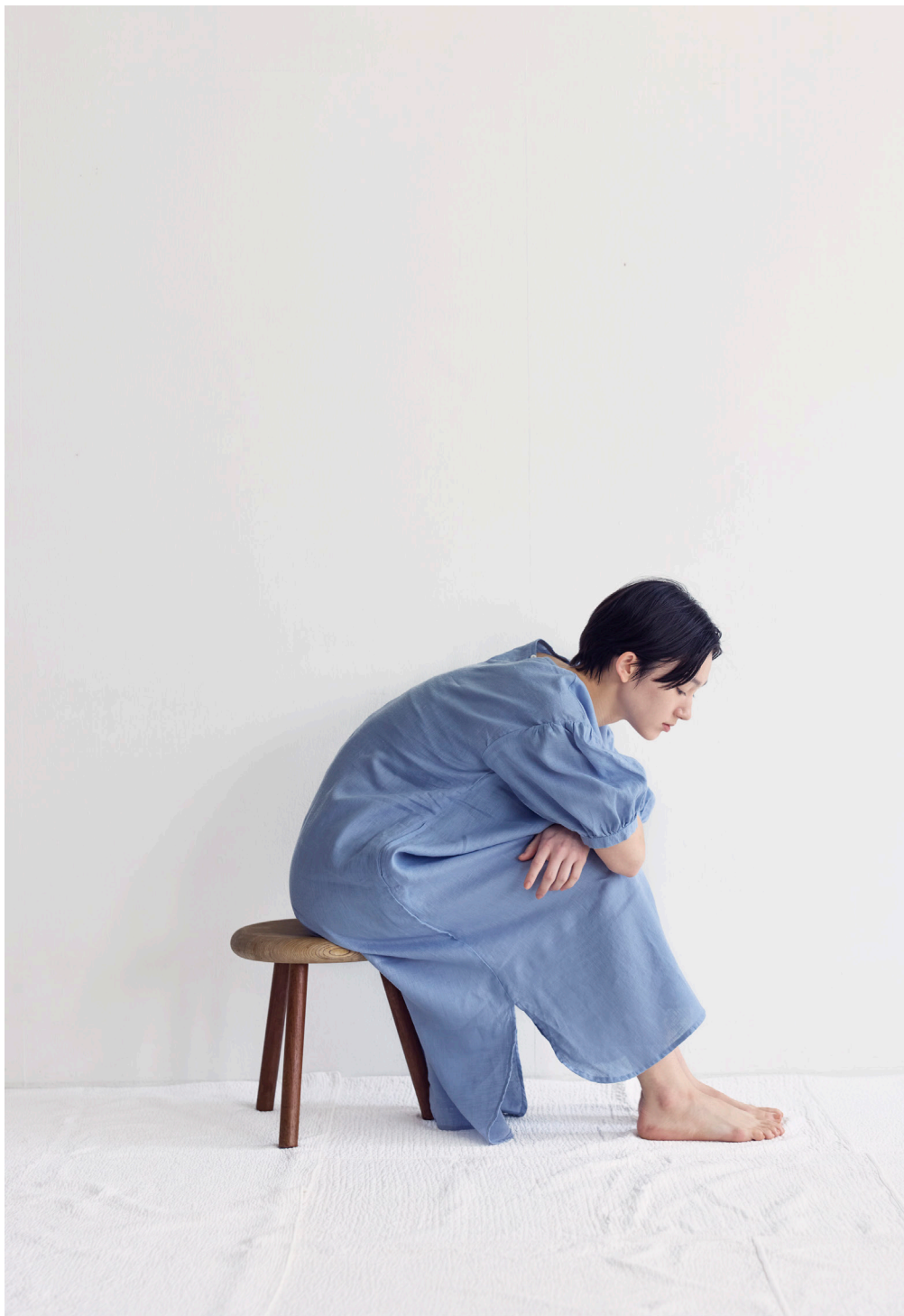
DOROTHY DRESS 【LWC053-630】