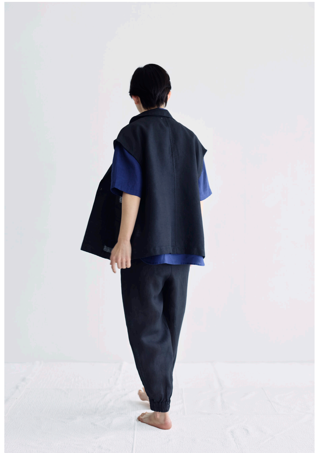
EMEL TOP [LWC047-91] JULIE GILET [LWC050-17] LEONIE PANTS [LC057-17]