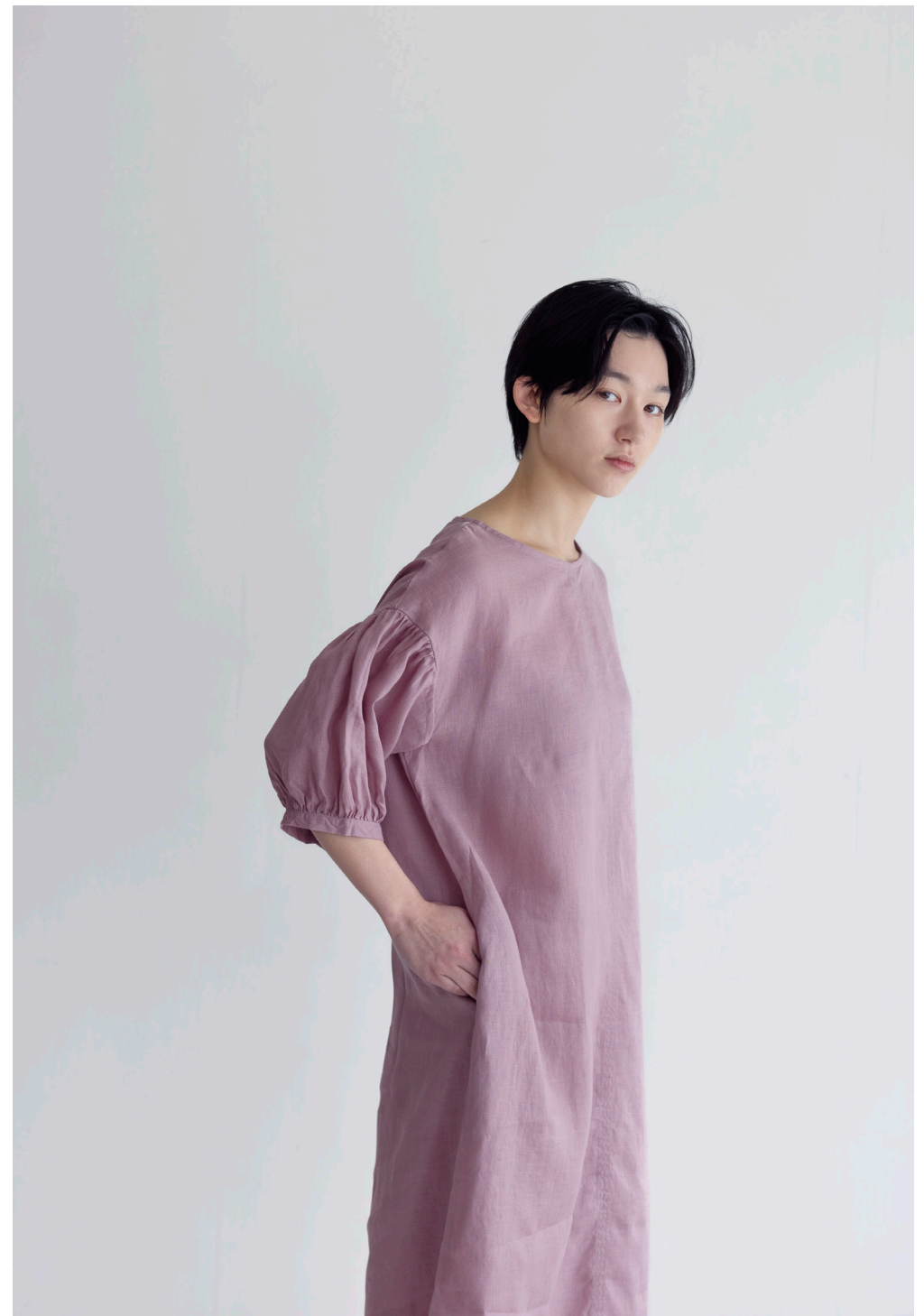
DOROTHY DRESS 【LWC053-2067】