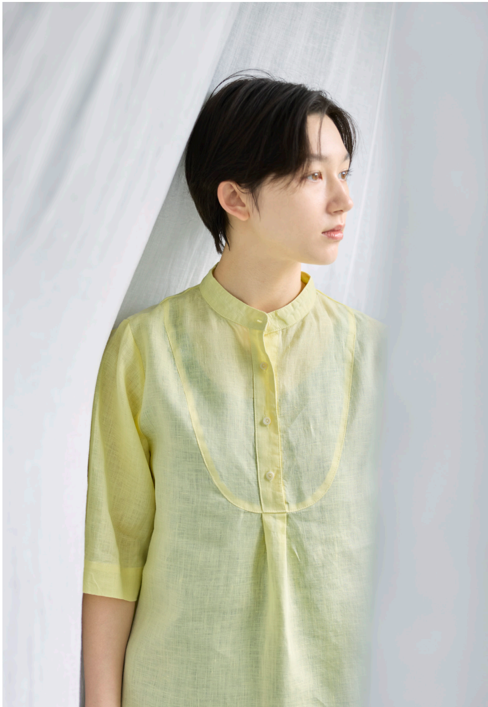
REMY TOP [LWC049-1010]