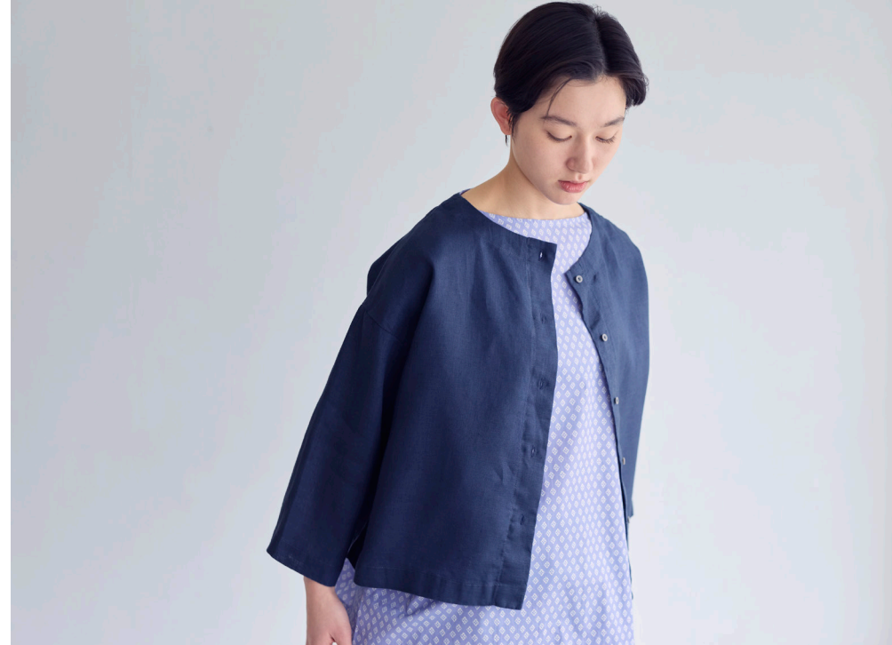
EMILE TOP [LWC0045-399] THAILI TOP [miiThaaii FJW456-72TLA]