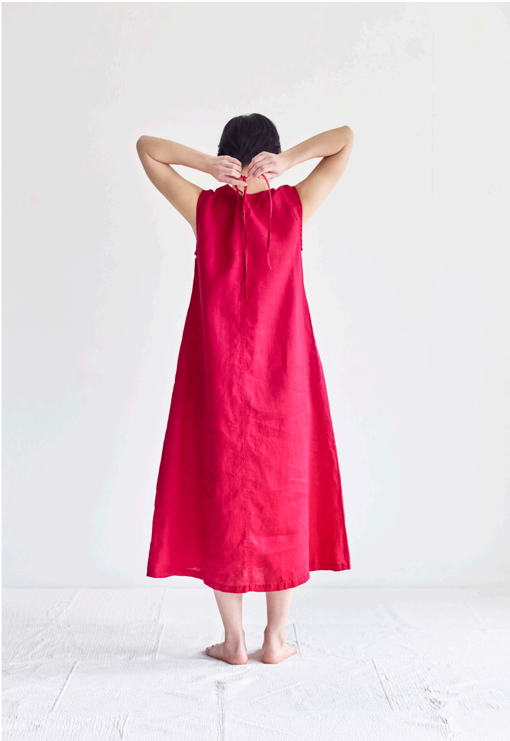
DANIEL DRESS [LWC055-10A]