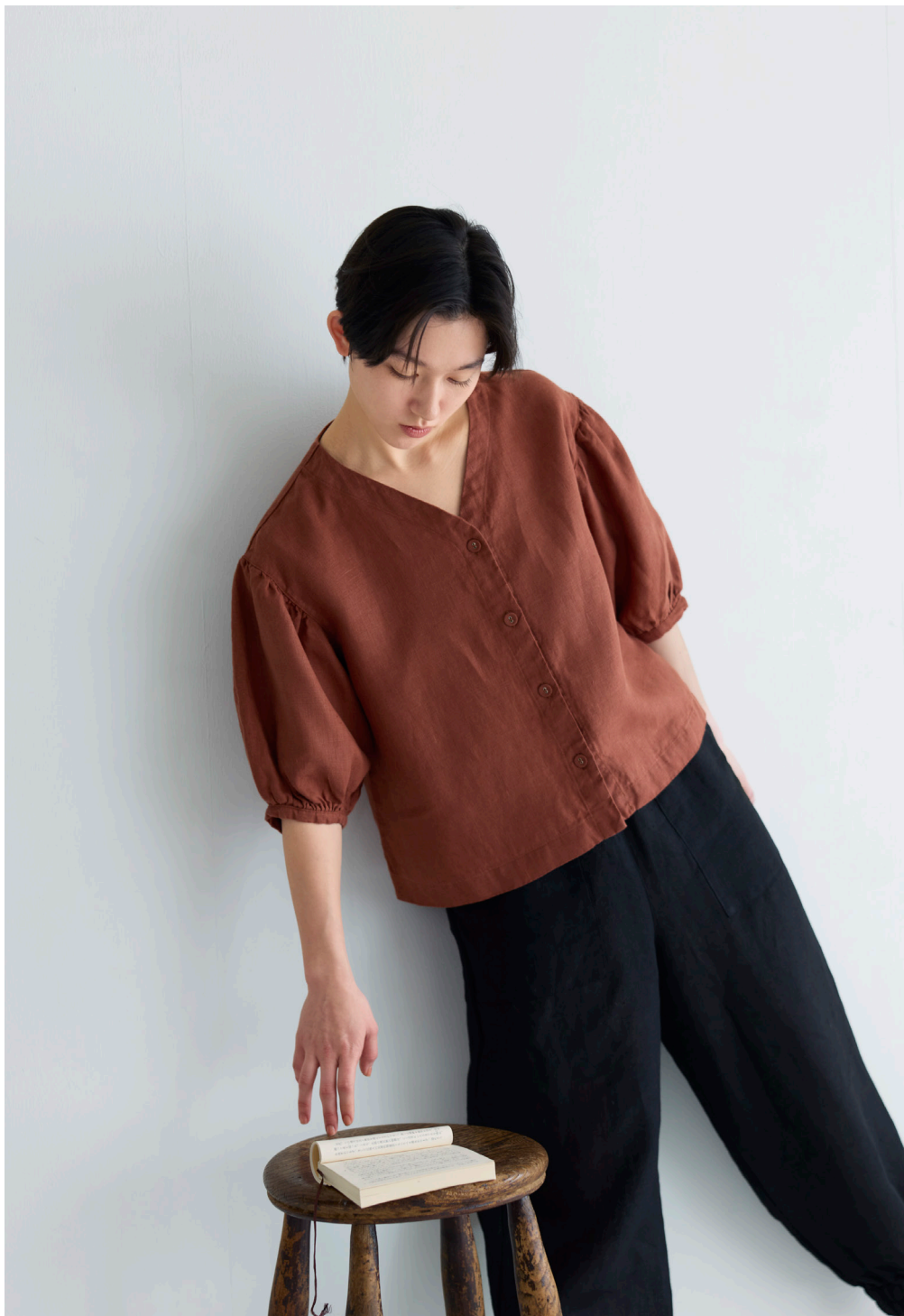
ELAIZA TOP [LWC048-2709] LEONIE PANTS [LC057-17]